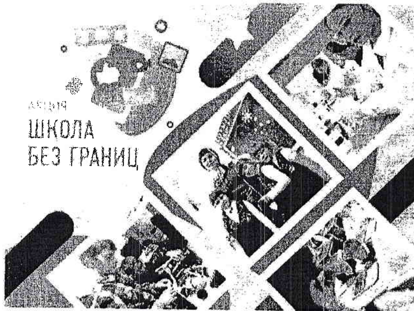
4. Баннер (1000*1000 px):